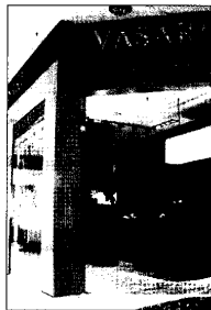
Punto de venta de Vasari.

Mercallevante, Valencia La firma de joyas, que este año cumple su 25 aniversario, ha elegido Valencia para continuar su expansión por España donde ya está presente en Andorra la Vella, Barcelona y Madrid. Con la apertura de la Joyería en Valencia, la firma Vasari reforzará su presencia en el área mediterránea. La nueva boutique de Valencia sigue los cánones de elegancia y sofisticación que caracterizan la firma. Líneas puras, delicadas y equilibradas proyectan en la decoración de la boutique la pasión por el diseño de Vasari. Cada joya es la protagonista en un espacio acogedor, tenuemente iluminado y que desprende un